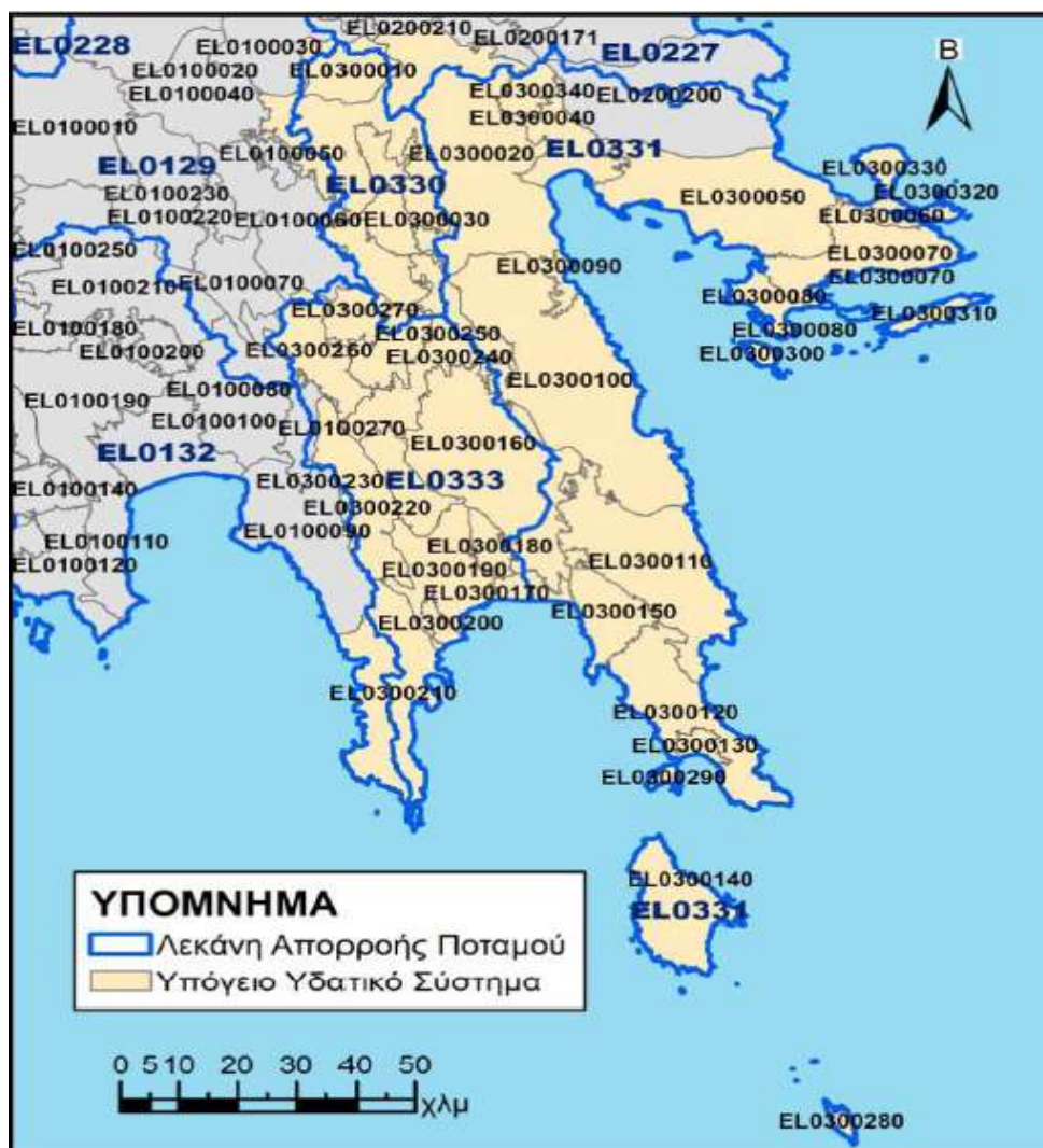
Χάρτης 1: ΥΥΣ ΥΔ Ανατολικής Πελοποννήσου

Όπως εμφανίζεται στον παραπάνω χάρτη, η πράξη «Ολοκληρωμένη διαχείριση δικτύων ύδρευσης στο Δήμο Βόρειας Κυνουρίας» οροθετείται στο Σύστημα «ΑΣΤΡΟΥΣ» ΕΛ0300090.