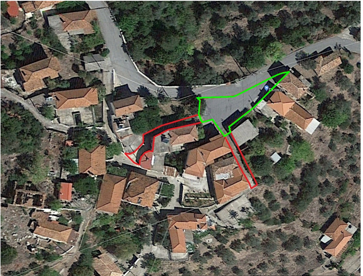
ΑΠΟΣΠΑΣΜΑ ΔΟΡΥΦΟΡΙΚΗΣ ΛΗΨΗΣ ΑΓΙΑΣ ΣΟΦΙΑΣ ( ΠΛΑΤΕΙΑ και ΔΗΜΟΤΙΚΟΙ ΔΡΟΜΟΙ )